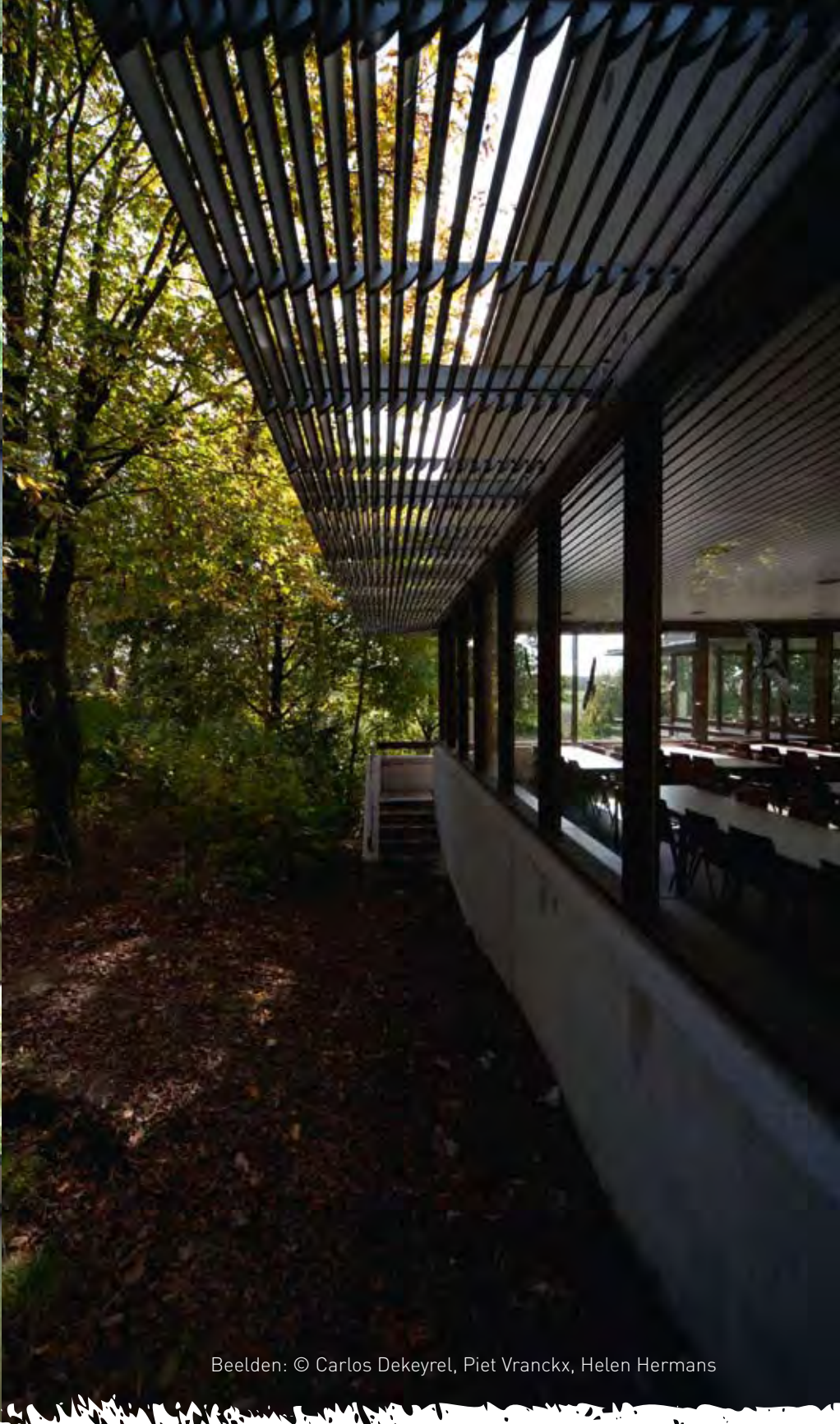
Beelden: © Carlos Dekeyrel, Piet Vranckx, Helen Hermans